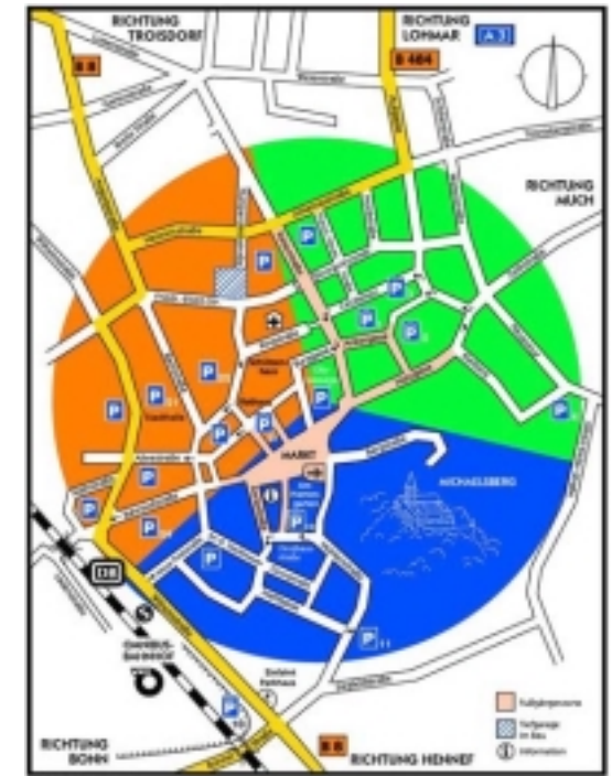
Lageskizze und Parkplätze

Stadtmuseum Siegburg Markt 46, 53721 Siegburg Tel.: 02241 / 96985-10